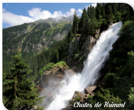
Chutes de Krimml

Petit-déjeuner buffet. Direction Schwaz - Visite guidée du Château de Tratzberg. Le petit train vous conduira du parking jusqu'au château, joyau Renaissance parmi les châteaux autrichiens. Déjeuner en cours d'excursion.