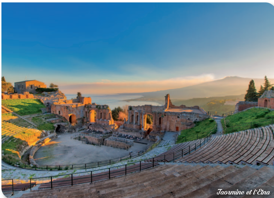
Taormine et l'Etna

Petit déjeuner à l'hôtel. Départ vers le port de Milazzo. Embarquement sur le bateau (sans autocar) à destination de Lipari. Débarquement et visite de l'île en bus (1 heure). C'est