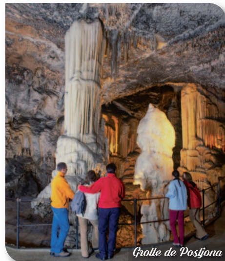
Grotte de Postojna

Petit déjeuner à l'hôtel. Puis départ pour le chemin du retour et déjeuner en cours de route.