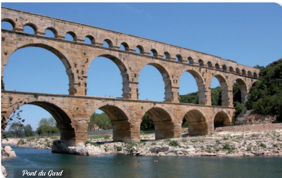
Pont du Gard