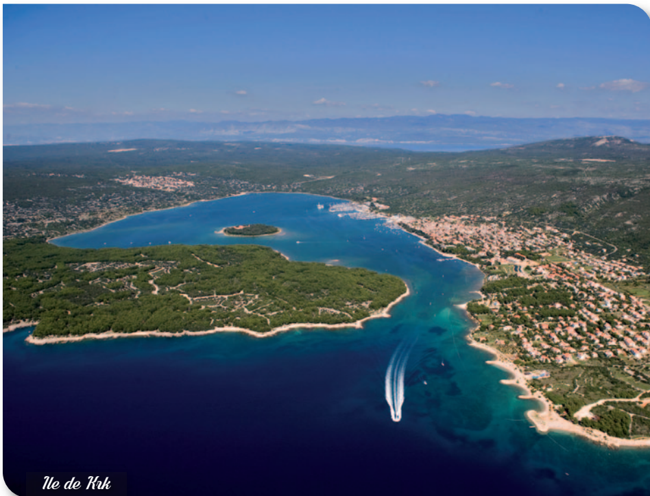
Ile de Krk

Petit déjeuner à l'hôtel. Départ pour Krk, la plus grande île croate. Visite de la charmante capitale avec sa promenade sur les remparts et ses ruelles dallées descendant vers le port. Déjeuner en cours de route. L'après-midi, arrivée à Rijeka, le plus grand port de la Croatie et la capitale de la région du Kvarner. Visite