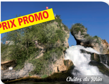
Châtes du Rhin